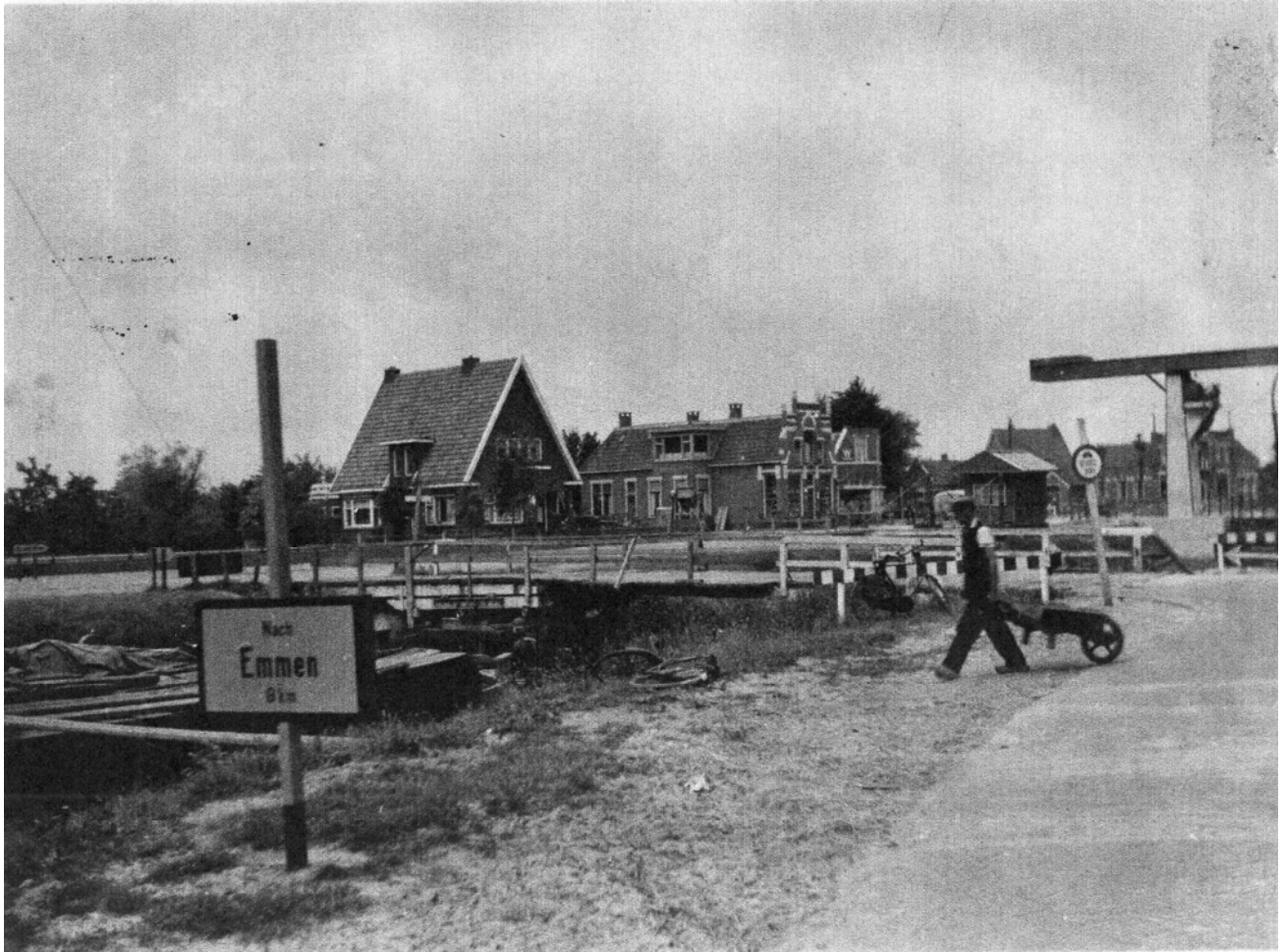
Brug bij Derde Kruisdiep, foto is van 1941.

Op deze foto van de brug, gelegen hebbende tegenover de boerderij Weerdingerkanaal z.z. 4 en gebouwd in 1902, is duidelijk te zien dat het is opgelapt. Bij het aanbreken van de oorlog in mei 1940 was de brug opgeblazen door Nederlandse militairen, om te voorkomen dat de Duitsers snel konden oprukken. De brug op de achtergrond lag voor de Tramwijk en is in september 1941 voor het verkeer opengesteld. Officieel is het geopend in juni 1947, tijdens het 75-jarig bestaan van Nieuw-Weerdinge. Voor de bevrijding op 11 april 1945 van ons dorp, hadden de Duitsers de bruggen bij het Derde Kruisdiep weer zodanig vernield, dat de bevrijders met hun tanks niet over de bruggen konden om hun doel Ter Apel te bereiken. Ze kregen de tip terug te gaan naar Weerdinge om via het Noordveen Nieuw-Weerdinge te bereiken. Opvallend is bord met opschrift "Nach Emmen". Wie herkend de man met de kruitwagen?